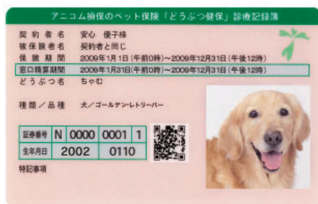
対応病院の窓口で提示していただく診療記録簿

※保険契約の有効性確認とは、動物病院で診療を受ける時点でおお客様の保険契約が有効であり、病院の窓口での精算が可能な条件を満たしていることの確認業務をいいます。